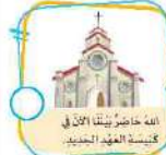
الله حاضرٌ بيننا الآن في كنيسة العهد الجديد.